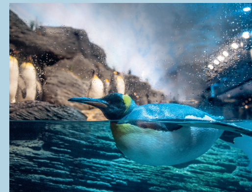
Les plumes brillent-elles ? Les yeux sont-ils plus clairs ? Autre considération : comment se reflète la lumière ultraviolette sur le bec ?

Avec cette expérience, nous espérons une meilleure sélection du partenaire. "Les manchots se regardent de manière très différente", poursuit Jan. "Les plumes brillent-elles ? Les yeux sont-ils plus clairs ? Mais aussi : comment la lumière ultra-violette se reflète-t-elle sur le bec ? Ils disposent ainsi de plus d'informations sur un partenaire éventuel, ce qui, espérons-nous, devrait augmenter les chances de reproduction de cette espèce menacée." Les