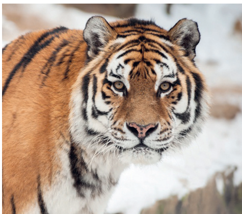
We kiezen bewust voor bedreigde grote katten, creëren zo bewust zijn én houden de soort in stand.