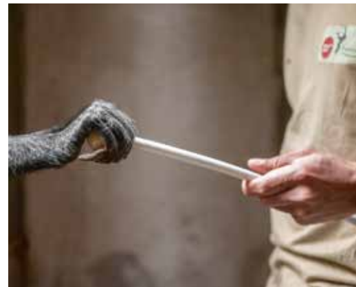
Het target is het instrument waar het om draait.