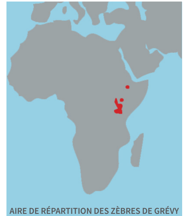
AIRE DE RÉPARTITION DES ZÈBRES DE GRÉVY