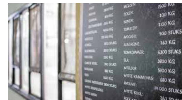
Sur le tableau de la cuisine des animaux, on tient à jour les quantités de nourriture ingurgitées.

L'enrichissement et l'entraînement sont pratiqués avec des ingrédients du menu. Pour l'ours à lunettes Oberon, des troncs d'arbres sont tartinés de petites quantités de miel ou de yaourt. Parfois, la portion d'un seul repas est répartie en plusieurs bouchées. Le lieu ou la manière dont il est présenté diffère aussi. Les fiches alimentaires sont sans cesse réévaluées et rectifiées. •