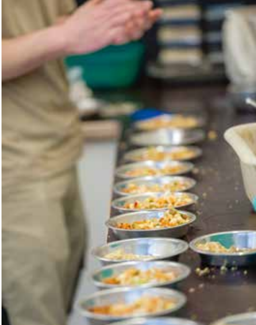
Chaque animal reçoit son repas personnel. Tout est fait sur mesure.